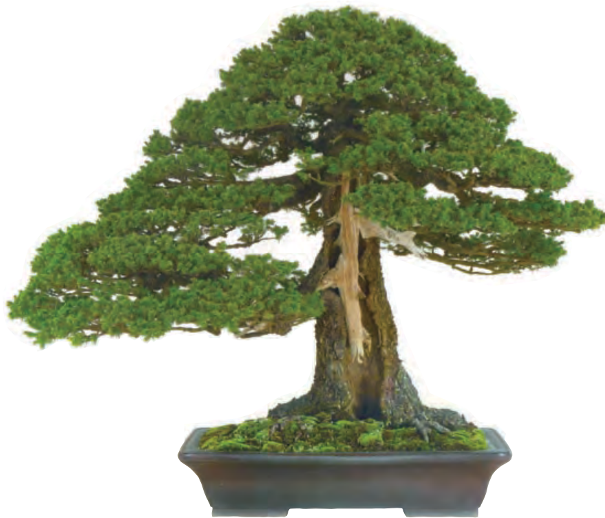
【樹－蝦夷松 鉢－大昭渡紫泥長方 樹齡－約800年】