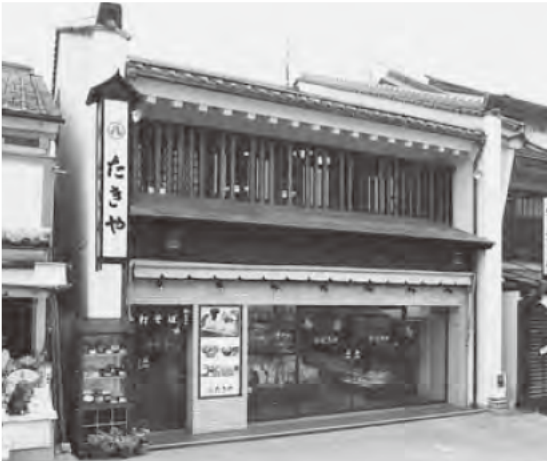
善光寺仲見世通り沿いの店舗

物をいただくました。私が一番に口にしたのはシソの天ぷらでしたが、サクッと美味しく揚がっていますので海老、ナスと次々に手が出ます。煮物も出し汁を充分に含んで調度良い味に出来ていま