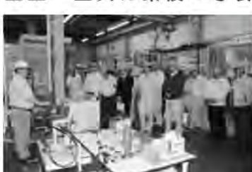
配管実験場で説明を受ける参加者

この後、受講者は工場内で配管材製造工程の説明を受けてから、屋外のエスロンヤードで耐火V.P.の燃焼実験を見学。さらに、配管実験場に移動し、各種実験を見学した。