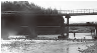
ふるさとの川「都幾川」

新春号の表紙は「ふるさとの川」シリーズとして、「都幾川」を選んでみた。 都幾川は、比企郡とさがわ町の大野地区高篠峠付近を源流とする