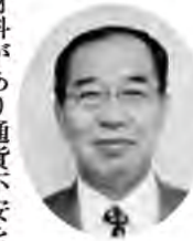
（社）埼玉県空調衛生設備協会

新年明けましておめでとうございます。皆様におかれましては、穏やかに平成25年の新春を迎えられたこととお慶び申し上げます。会員、関係皆様方の厚いご支援ご協力によりまして、当協会運営が順調に進められておりますことを厚く御礼申し上げます。