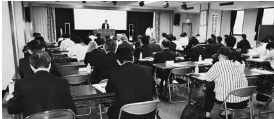
働き方改革をテーマに開かれた月例会