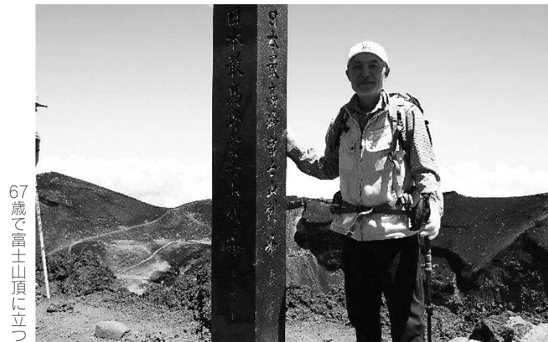
67歳で富士山頂に立つ

らバスで終点のケーブル下バス停まで行き、そこから御岳山ケーブルで御岳山駅へ。 南浦和駅を出発して電車とバスとケーブルを乗り継いで御岳山駅まで、およそ2時間15分。 御岳山駅でケーブルカーを降りてから、御岳山神社を通過してロックガーデンを回り御岳山駅に戻ってくるコースは、およそ6km。ゆつくり歩いて3時間ほどだから、年寄りの日帰り山歩きにはちょうど良い。昨年の夏には、ロックガーデンから更に足をのびて日の出山に登り、そこからつるつる温泉まで6時間ほど歩いた。