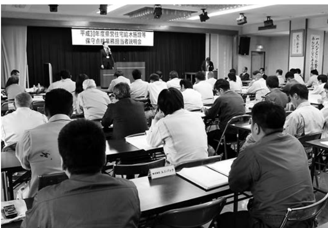
県営住宅の保守点検に際し公社の担当者から説明を受けた

さらに業務に要する 費用の負担区分の明確 化、7月1日を境に単 価が変わることから使 用に注意することなど 各項目について説明が ありました。