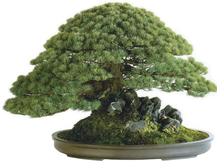
【ゴヨウマツ(五葉松) 鉢一大沼渡紫泥楕円 樹齡一約250年】